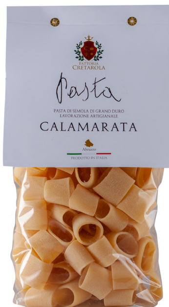
Fattoria Cretatola Calamarata