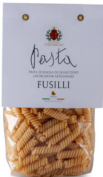
Fattoria Cretatola Fusilli