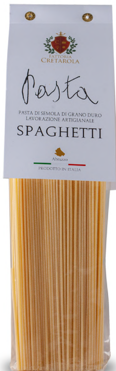
Fattoria Cretatola Spaghetti