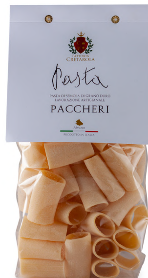
Fattoria Cretatola Paccheri