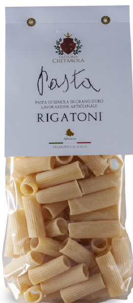
Fattoria Cretatola Rigatoni